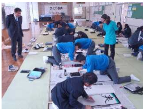
【思いきり筆を動かす生徒たち】

説明を受けた生徒たちは、それぞれの学年の課題について一生懸命に取り組み、分からないことは金川先生に質問をし、教えていただきながら書いていました。生徒たちは初めての席書会でしたが、良い作品ができた満足そうでした。