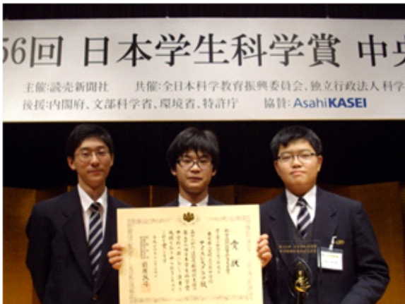
【日本科学未来館での表彰】

サイエンス部では、新たな研究テーマに向け、活動を始めており、生徒と共に研究や探求する楽しさを味わっています。