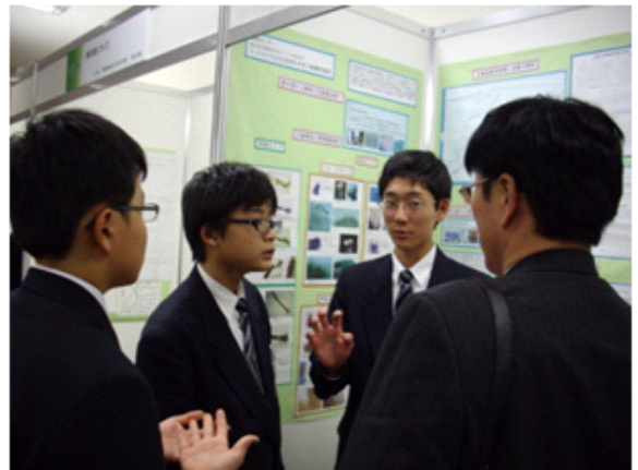
【中央最終審査で一生懸命に説明する生徒】