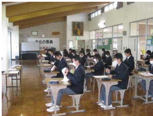
【緊張しながら開始を待つ生徒】

毎日コツコツと取り組むことが、基礎学力定着への最大の近道となります。頑張りましょう。