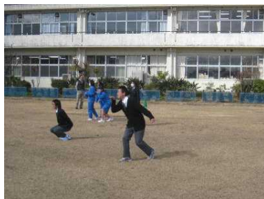
【だるまさんがころんだ】