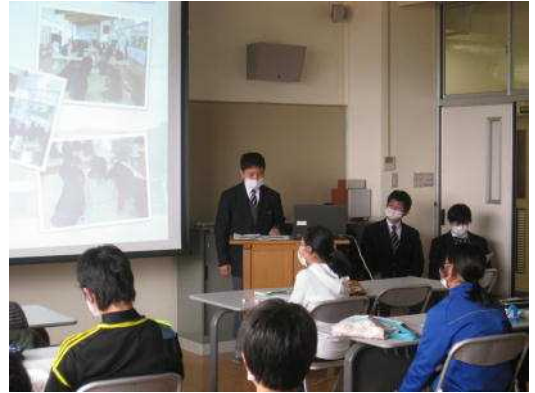
【スライドを使った学校案内】

2月5日(火)に新入生保護者説明会、2月6日(水)に新入生説明会を実施いたしました。新入生説明会では、三原小・末吉小6年生児童に中学校生活の一部を見学したり、体験してもらいました。全学年の授業参観後に数学の模擬授業を体験しました。緊張しながらも全員一生懸命課題に取り組んでいました。その後、生徒会役員による学校紹介をスライドや冊子を使いながら行いました。生徒会役員は新入生に、少しでも入学への不安をなくし安心して登校できるように一生懸命に説明していました。