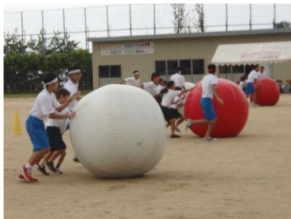
【児童・生徒による大玉転がし】

15日に予定していた体育祭は台風18号の影響で延期となり、今年は21日に実施することができました。体育祭当日は、時々小雨が降ったりする天候でしたが、その天候を吹き飛ばすように、生徒、保護者、地域の方々、小学校の児童の皆さんは、それぞれの競技に一生懸命に取り組み、とても素晴らしい体育祭となりました。今後もよりよい体育祭を実施できたらと思っています。