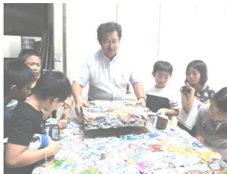
クリーンセンター