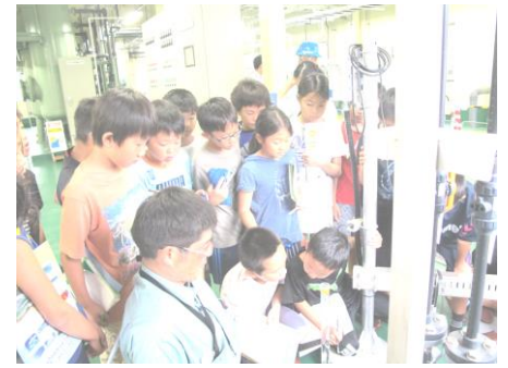
水海山最終処分場