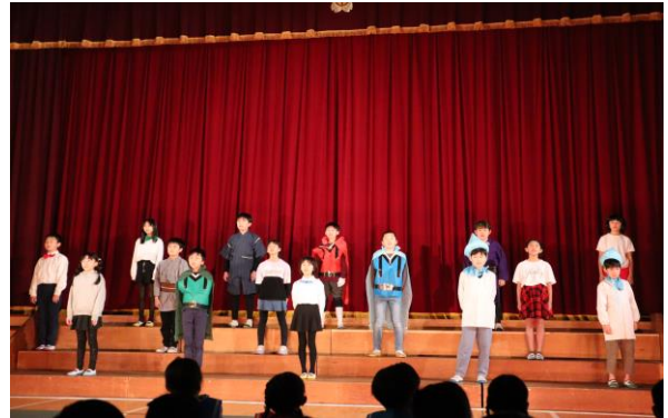
4年生 劇「かけがえのない水」