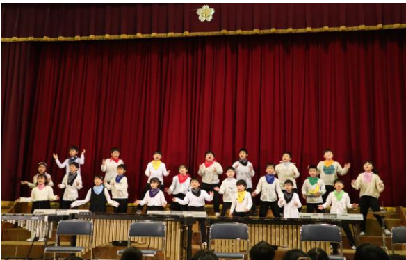
3年生 合唱「オー・ハッピー・デイ」