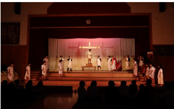
6年生 劇「ぶっ走れメロス」