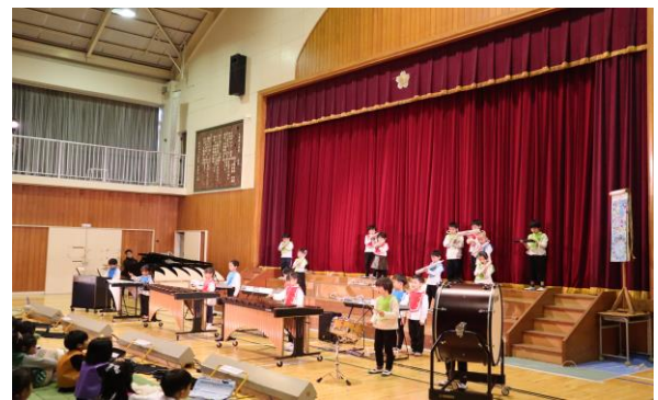
1年生 合奏「聖者の行進」