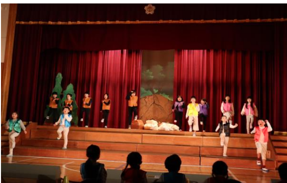
2年生 劇「アイウエオリババ」