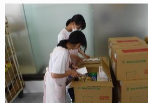
大賀郷薬局 品出しやレジ打ちを体験しました。