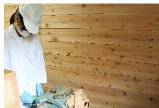
あしたば加工工場 明日葉の加工品について学び、作成をお手伝いしました。