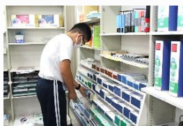
大志堂 レジ打ちや値札貼り、配達をしました。