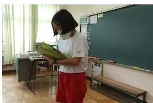
大賀郷小学校 健康チェックやプリントの配布、宿題の回収などをしました。