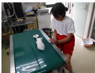
八丈島動物病院 猫の餌やりや事務作業を行いました。