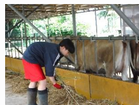
ゆーゆー牧場 搾乳の手伝いや牛の餌やりをしました。