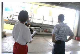
八丈島空港 アナウンスやクリーニング、空港の整備について体験しました。