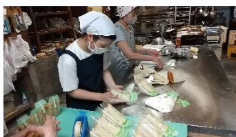
やたけ製菓 パン作りの体験やサンドイッチ包装をしました。