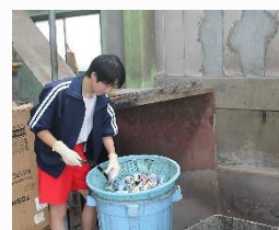
八丈町役場 クリーンセンターに行って作業をしました。