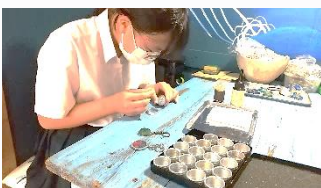
雑貨屋ラミ 材料集めをし、アクセサリを作りました。