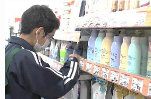
あめのもり 品出しや商品管理等多くのことを体験しました。