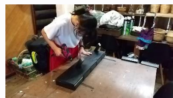
ウルクラフト 解体作業や作品作りを体験しました。