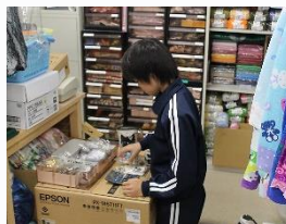
くれよん レジ打ち、品出しや値札貼りをしました。