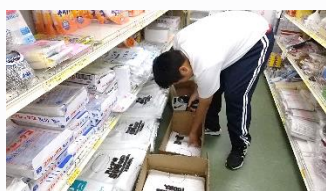
中村商店 レジ打ち、品出しを体験しました。