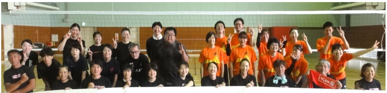
大賀郷中学校 学年対抗バレーボール大会

このバレー大会に向けて、6月からは週2回、多い日は参加者総勢 30 人を超える中、楽しく親睦を深めながら練習を積み重ねてきました。大会当日は、日々の練習の成果を発揮し、どの学年もお互いに励まし合い、称え合いながらの熱い!暑い!戦いとなりました。見事優勝したのは、3学年!(3連覇達成おめでとうございます!) 大中の団結力を再確認できた1日でした。素晴らしい大会をありがとうございました。9月の P 連球技大会もどうぞよろしくお願いいたします。