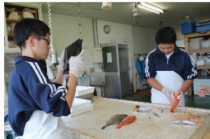
水産試験場 海のことや漁業のことについて学びました。