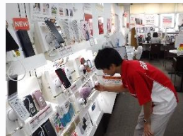
ドコモショップ 商品の整理や店内の清掃など体験しました。