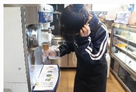
ジャージーカフェ 接客やソフトクリーム作りを体験しました。