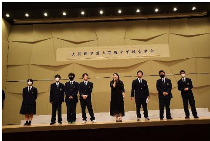
音楽会実行委員会

延期になったことで、多くの方にご心配をおかけしましたこととお詫び申し上げます。音楽会を迎えるにあたり、大中学生はスローガン「Happy melody 笑顔アフレテ強くなる」を掲げました。本番の何倍もの長い時間をかけて練習や準備をし、体調と心を整えてきました。どうしたらもっといい演奏ができるか、本番直前まで突き詰めていく姿がとても素晴らしかったです。大中学生の努力と笑顔が演奏に表れ、会場の皆様に届いていたら幸いです。たくさんの応援と拍手をありがとうございました。来年も、よろしく願いいたします。 音楽科